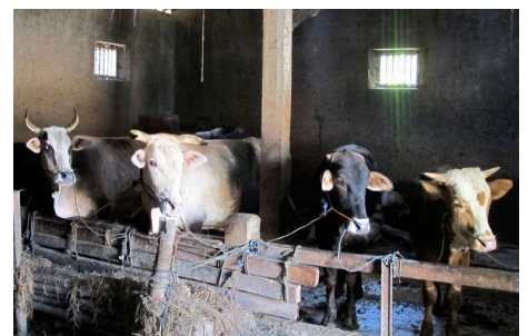
Das Programm ist in verschiedenen Provinzen Indonesiens aktiv. Auf der Insel Java mit seiner muslimischen Bevölkerungsmehrheit ist Kuhdung die primäre Quelle, um Biogas zu gewinnen.