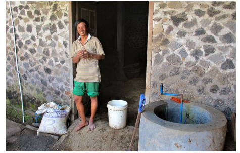
Kleinbauer Sukrano auf Java ist zufriedener Besitzer einer Klein-Biogasanlage aus diesem Programme of Activity.