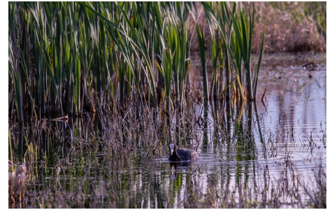
Aber auch für andere Vögel sind Moore wichtige Lebens- und Rückzugsräume wie das Blässhuhn mit dem leuchtend weißen Hornschild über dem Schnabel...