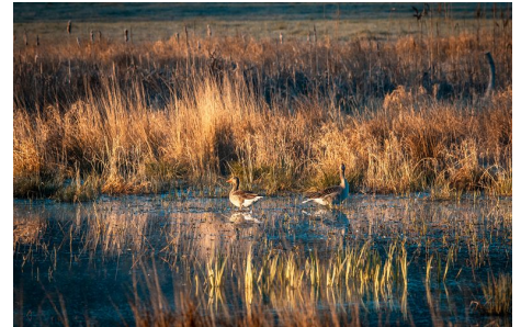
... oder Graugänse, die in Feuchtgebieten gerne brüten ...