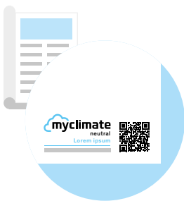
Label mit Trackingnummer