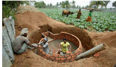
Indien Bau von Biogasanlagen