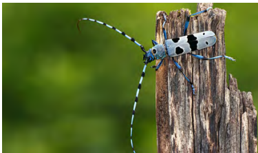
Schweiz Tier-, Natur- und Klimaschutz

Mit einem kleinen, auf Ihren Auftrag bezogenen Beitrag unterstützen Sie hochwertige myclimate Klimaschutzprojekte.