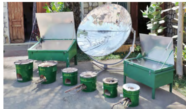
Madagaskar Solarkocher und effiziente Kocher