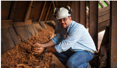
Brasilien Strom aus FSC-Holzabfall im Amazonas